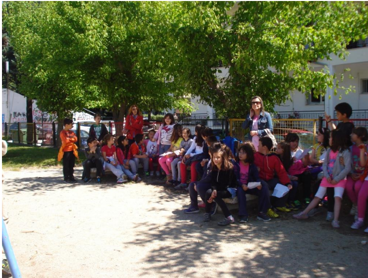
10. Παράσταση θεάτρου σκιών : Ο Καραγκιόζης φούρναρης